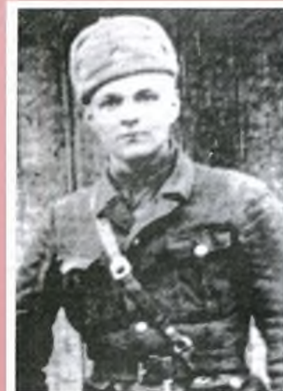
Снимок Юрия Бондарев. 1944 г.

Цензура тогда строго следила за тем, чтоб не было «дегероизации подвига» и чрезмерного внимания к мрачным и неприглядным сторонам войны. Но Бондарев не акцентировал внимания на черноте, крови и грязи. Но и никакого пафоса, красивых слов, псевдо-героизма и ура-патриотизма в его книгах тоже нет. Там всё просто, по жизненному. Ведь Юрий Васильевич войну пережил сам. Поэтому он знал, что писал и что делал.